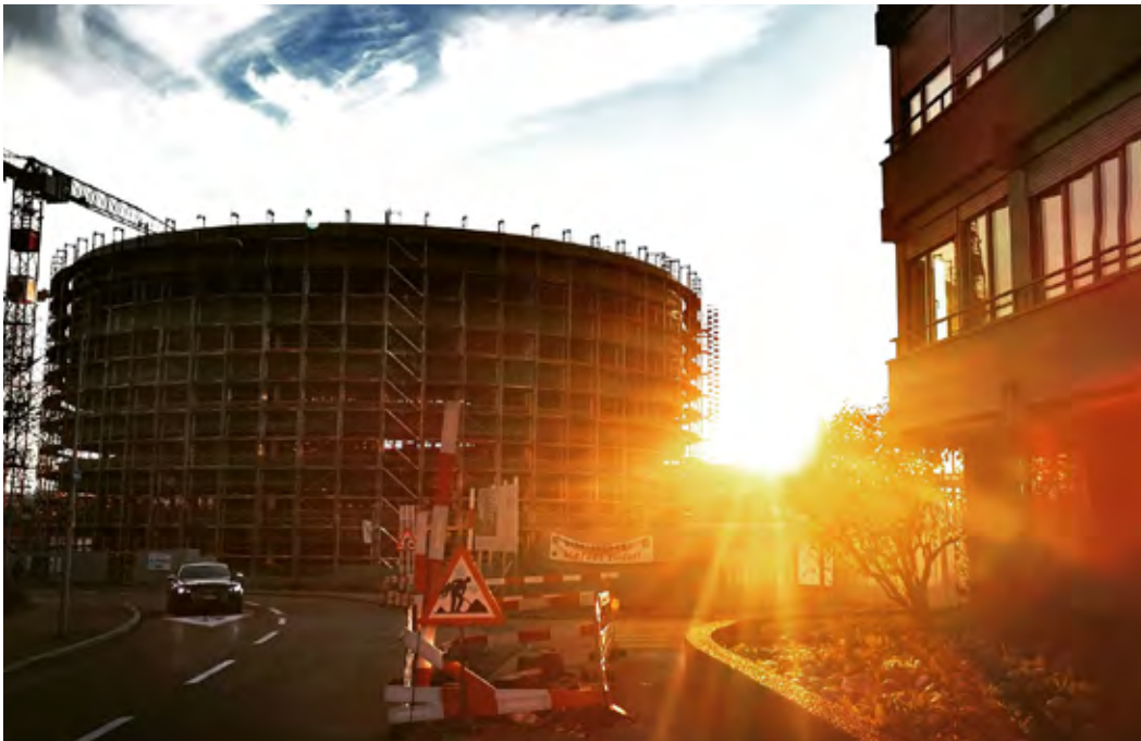
Das Foto zeigt die untergehende Sonne am Balgrist mit dem neuen Forschungsturm des Kinderspitals.

Für viele Menschen weltweit wird das Jahr 2020 nicht positiv im Gedächtnis bleiben. Zig Tausende haben überraschend liebe Angehörige verloren und konnten sich nicht einmal auf angemessene Art und Weise verabschieden; andere leiden unter schweren Spätfolgen der durchlittenen Covid-Erkrankung. Gerade die ohnehin sozial und materiell Benachteiligten haben zusätzliche, nicht verkraftbare finanzielle Verluste hinnehmen müssen, viele ihren Job verloren. Ganze Familiensysteme werden auf die Probe gestellt, familiäre Gewalt hat zugenommen. Psychisch Belastete kamen an ihre Grenzen, die Suizidrate ist gestiegen, die Psychiatrien sind voll.